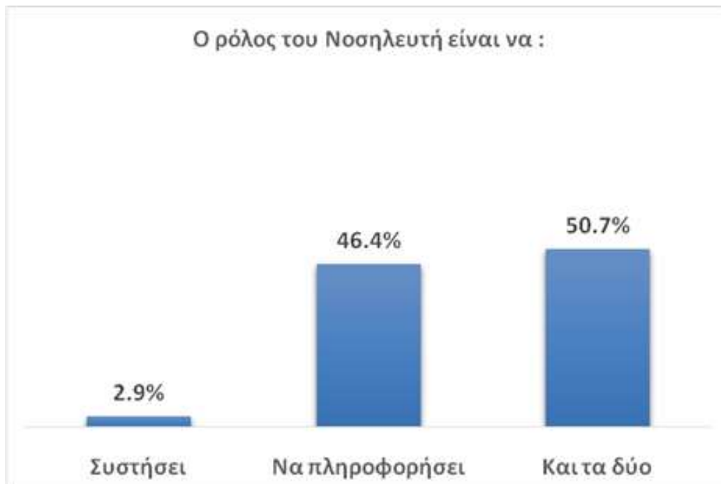
Γράφημα 2. Στάσεις σχετικά με τον ρόλο των επαγγελματιών υγείας